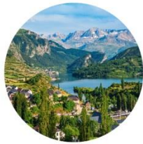
Vallée de Tena