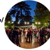
Tourmalet/Pic du Midi