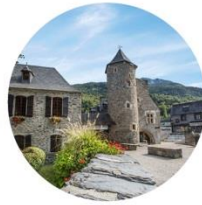
Vallée de Saint-Lary