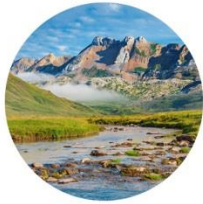
Vallées de Hecho et Ansó