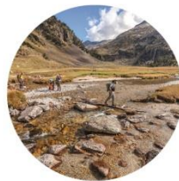
Benasque / Aneto