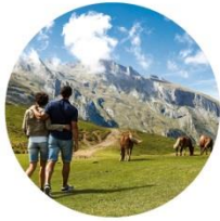
Argelès-Gazost / Val d'Azun