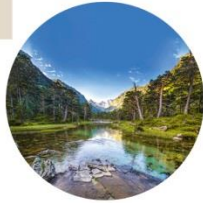
Cauterets Pont d'Espagne